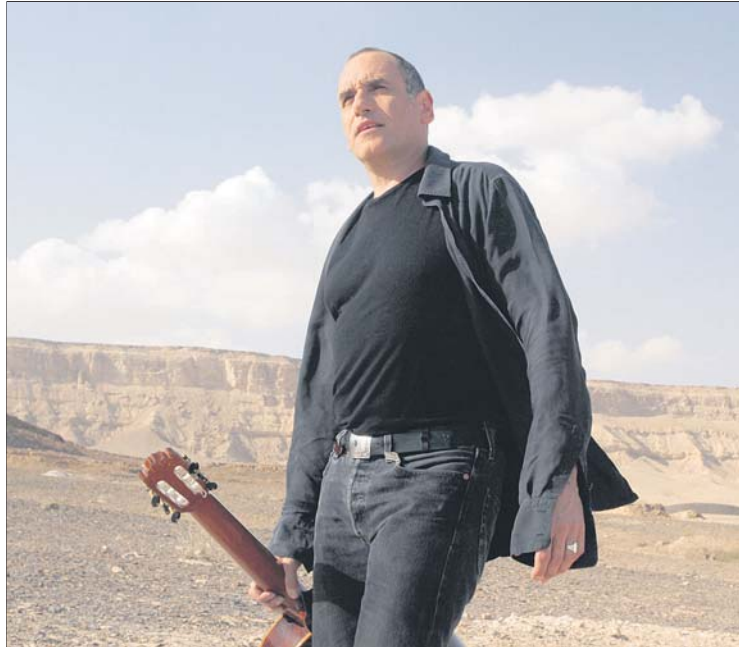
A beneficio. Con las ganas de exportar su mensaje de paz, un israelí llega desde tierras áridas a Montevideo.